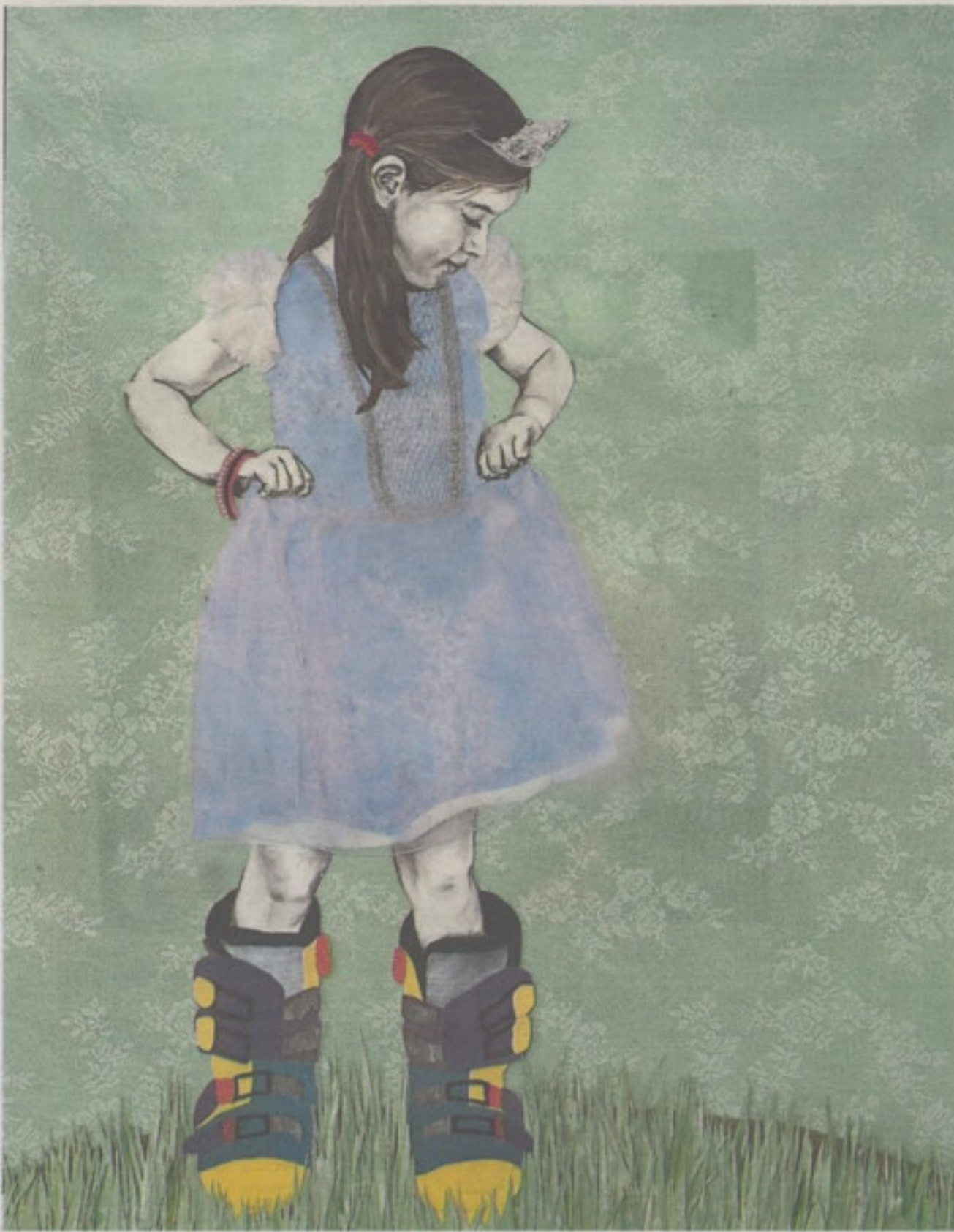
Werk van Tabitha Sluis.